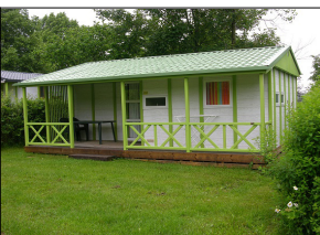
Chalet 1/6 personnes