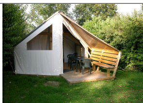
Tente lodge 1/4 Personnes

Arrivée après 16h 00 Départ avant 10h 00