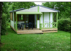
Chalet 1/5 personnes